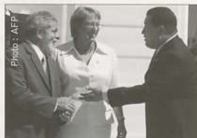
Trois présidents de « gauche »... à droite : Lula, Brésil - Bachelet, Chili - Chavez, Venezuela.

Après certaines déclarations tapageuses suite à la première élection de Lula au Brésil, l'administration américaine a plutôt à se féliciter du comportement du Brésil et il a accueilli sans rictus les élections de